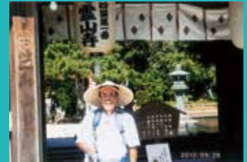
68歳 八十八ヶ所歩き遍路スタート 第一番札所 霊山寺にて