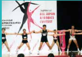
55歳 エアロビクス中四国大会 シニアクラス2位