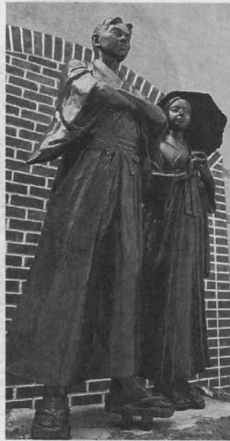
設置された坊っちゃんとマドンナの銅像—松山市大街道3の松山城山ロープウェイ東雲口駅前