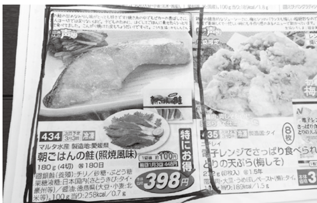
とても美味しいですよ

A：現在は45名です。構成は管理部門、営業部門、加工部門があり、加工部門の方が35人います。その中には10人の、19歳から26歳のベトナム人技能実習生の方がいます。ベトナムの方は期間が満了したら帰国されます。今は法律が変わり以前より延長されて5年以上でも日本で働くことができるのですが、去年はコロナ禍の影響で入国