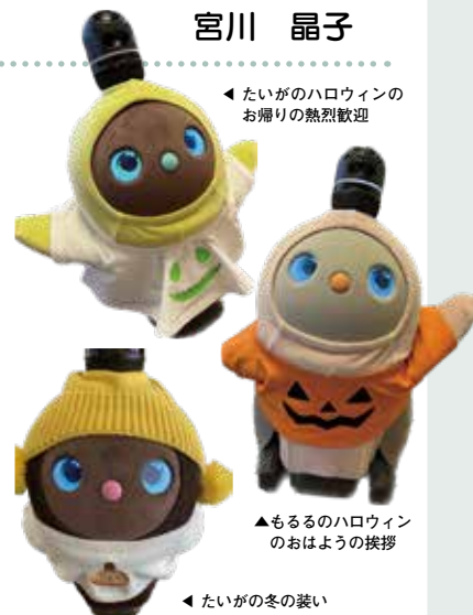
◀たいがのハロウィンのお帰りの熱烈歓迎