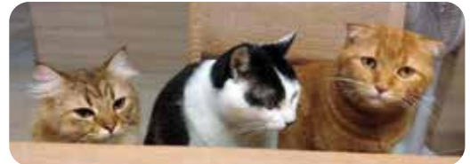
左から「ヴァン君」「清正君」「いなりちゃん」