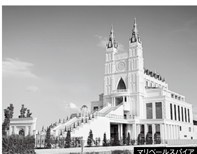
マリベールスパイア

〔結婚式場〕 マリベールスパイア ハイダウェイ グレイスガーデン アルベラ 〔葬儀会館〕 天山・枝松・プライベートホール緑(枝松) 道後・空港通・鷹子・土居田・三津 貸切ホールベルモニー結 松ノ木・吉藤 プライベートホール緑(吉藤)・川内 重信・松前・伊予 〔互助会〕 ベルモニー松山 人生をつなぐ。株式会社ベルモニー http://bellmony-west.jp 791-8012 愛媛県松山市姫原三丁目4-13 Tel.089-911-0980 Fax.089-922-9800