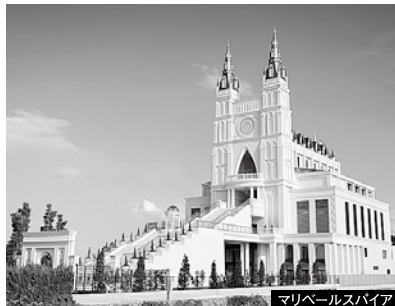
マリベールスパイア

人生をつなぐ。株式会社ベルモニー http://bellmony-west.jp 791-8012 愛媛県松山市姫原三丁目4-13 Tel.089-911-0980 Fax.089-922-9800